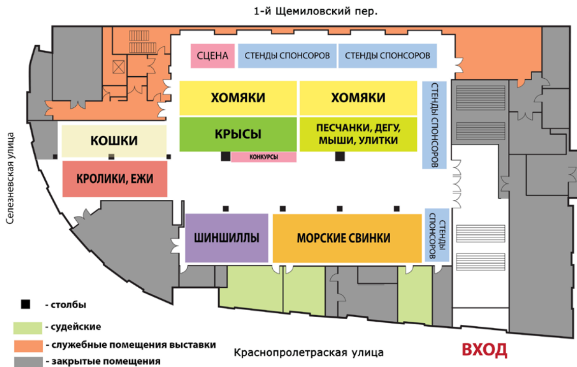
Схема расположения секций на примере выставки «ЗооПалитра»®. Весна 2016

Выставка «ЗооПалитра»® включает в себя несколько экспозиций, состав и количество которых зависит от видов животных, заявленных на конкретное мероприятие. Отдельными экспозициями могут быть представлены морские свинки, кролики, ежи, птицы, реже шиншиллы. С весны 2015 года на выставке работает экспозиция кошек.